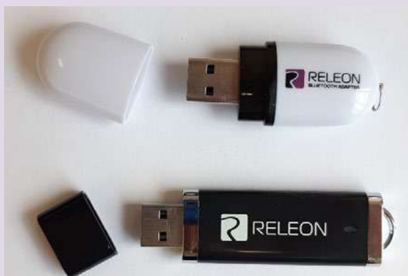
Рис. 13. Общий вид USB-флеш-накопителя (внизу) и Bluetooth-адаптера (вверху) Releon

В комплекте цифровой лаборатории Releon поставляется программное обеспечение Releon Lite на USB-флеш-накопителе, а также Bluetooth-адаптер для связи регистратора данных с беспроводными датчиками (рис. 13).