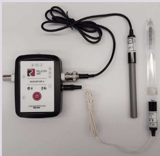
Рис. 10. Ионоселективный датчик (присоединены электро хлорид-ионов и электрод сравнения)

Датчик кислорода — предназначен для определения относительной концентрации кислорода в воздухе. Диапазон измерения: от 0 до 100 %. Разрешение: 0,1 %. Технологические особенности: при измерении содержания газа в выдыхаемом воздухе необходимо держать мембрану максимально близко ко рту; восстановление показаний на воздухе происходит через 1—2 минуты (время диффузии через мембрану).