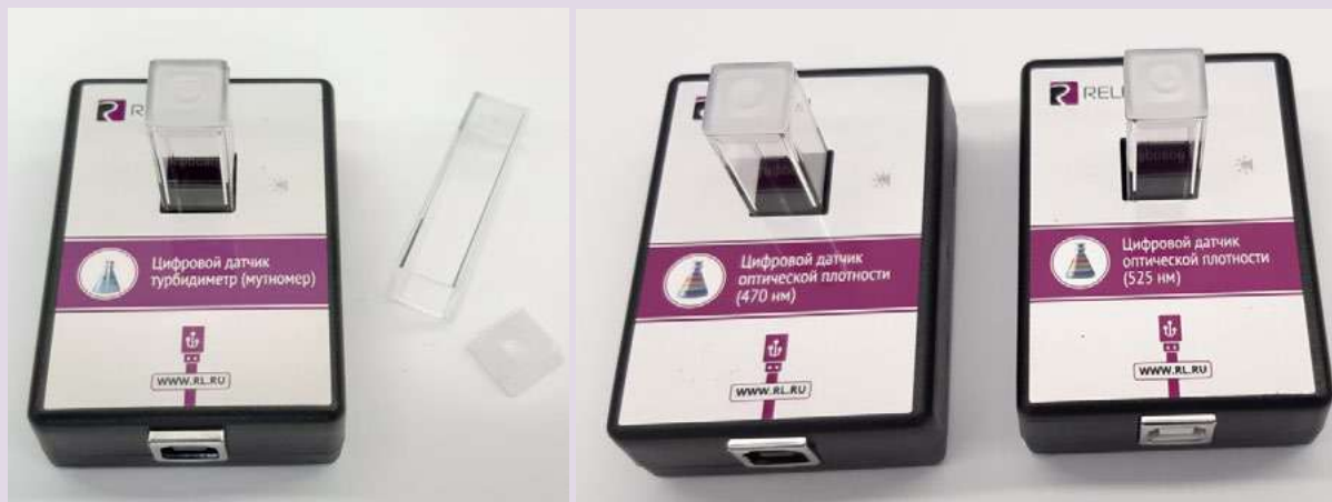
Рис. 8. Датчики мутности (слева), оптической плотности на 465 нм (в центре) и 525 нм (справа)

В комплект входят датчики с различной длиной волн полупроводниковых источников света: 465 и 525 нм. Диапазон измерения коэффициента пропускания света: от 0 до 100 %. Разрешение при измерении коэффициента пропускания: 0,1 %. Диапазон измерения оптической плотности: от 0 до 2 D. Разрешение при измерении оптической плотности: 0,01 D. Длина оптического пути кюветы: 10 мм. Объём кюветы: 4 мл. Технологические особенности: требуется хорошо промывать кювету для исследуемого раствора.