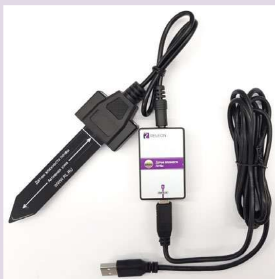
Рис. 4. Датчик влажности почвы

Датчик влажности почвы — предназначен для измерения степени увлажнения почвы, выраженной в процентах. Применяется в агроэкологических и сельскохозяйственных исследованиях.