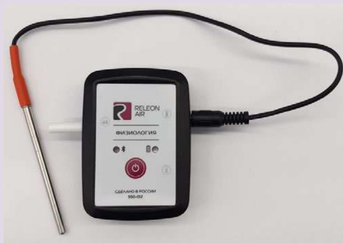
Рис. 12. Датчик температуры тела

Датчик температуры тела — предназначен для непрерывного измерения температуры тела в подмышечной впадине. Оснащён выносным зондом. Диапазон измерения: от 25 до 50 °С. Разрешение датчика: 0,1 °С. Технологическая особенность: для точного измерения в подмышечной впадине должна находиться вся металлическая часть зонда.