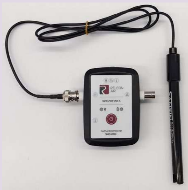
Рис. 5. Датчики электропроводимости

Датчик электропроводимости — предназначен для регистрации и измерения удельной электропроводности жидких сред, в том числе и водных растворов веществ. Применяется при изучении характеристик водных растворов, в том числе почвенных вытяжек.